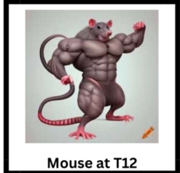
Mouse at T12