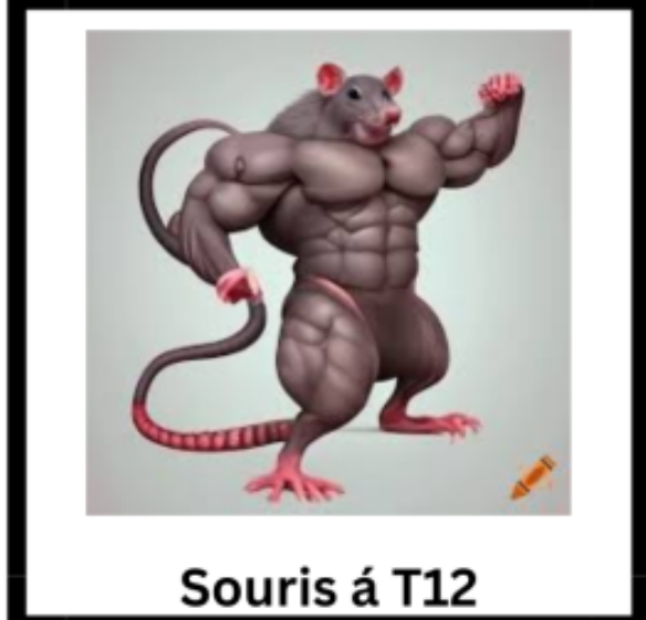
Souris á T12