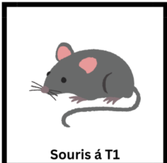
Souris á T1