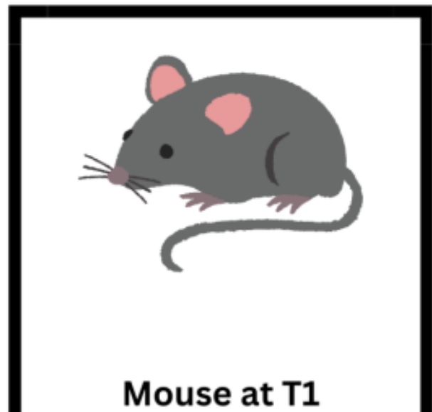
Mouse at T1